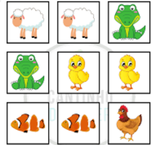
JOGO DA MEMÓRIA DOS ANIMAIS

4-Explore brincadeiras onde a criança precisa esperar sua vez. Jogar bola na cesta, por exemplo: “Primeiro eu jogo — agora é sua vez!”. Jogos com bola, amarelinha e jogo da memória são boas opções!