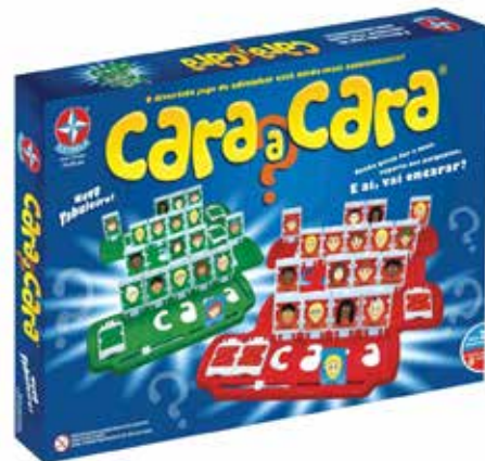
CARA A CARA