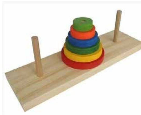
TORRE DE HANOI