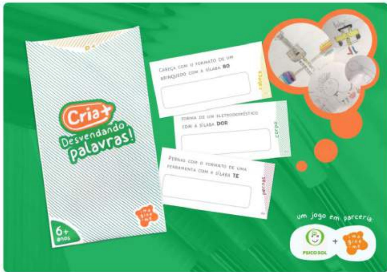
Cria+: Desvendando Palavras