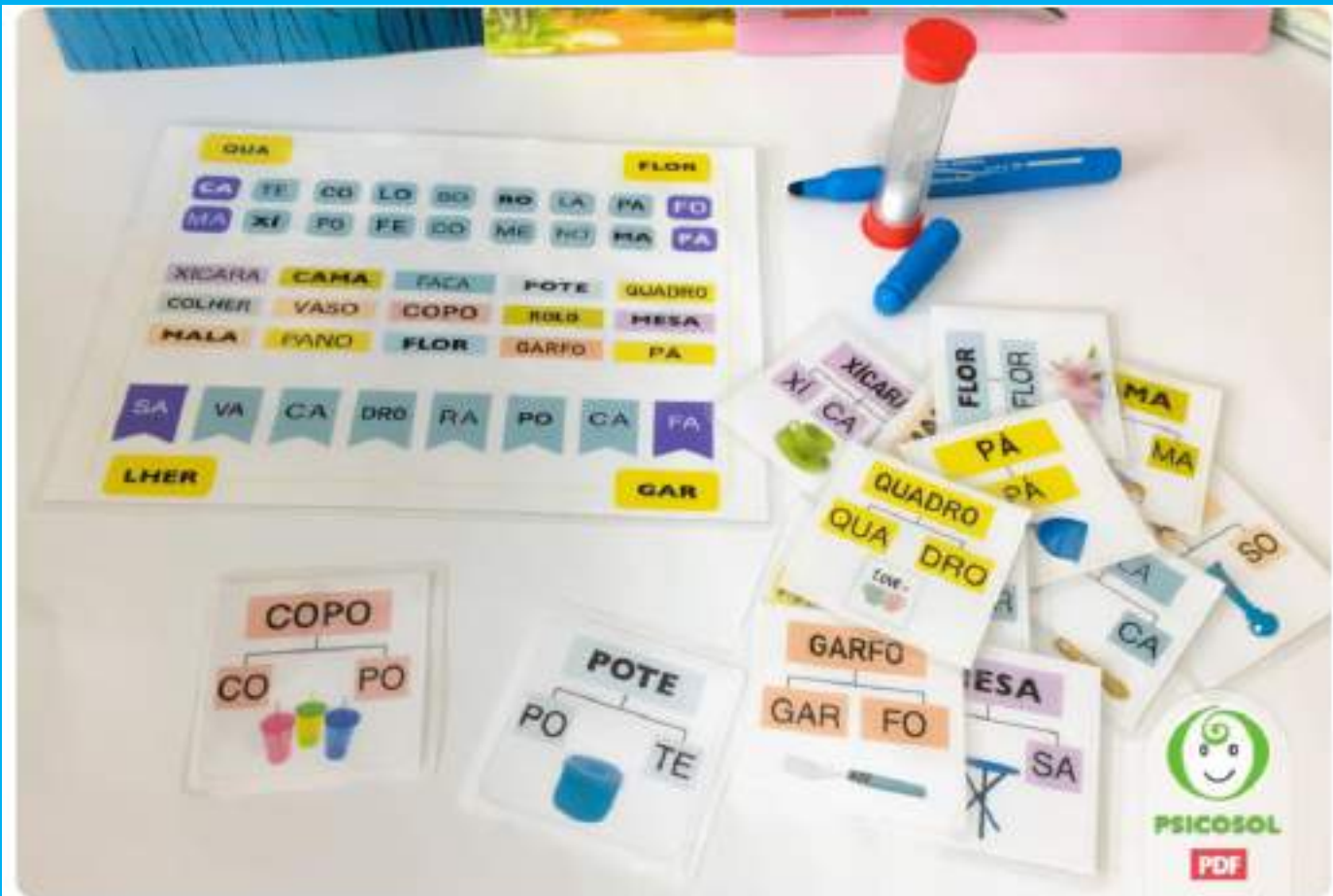
Caça sílabas e palavras