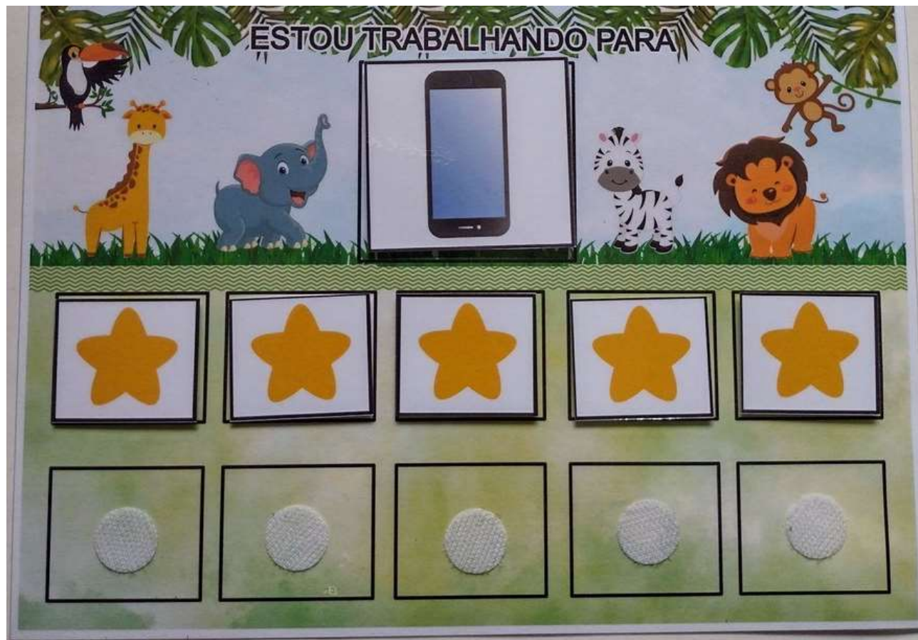
Imagem Ateliê Pedacinho Azul