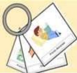
CARTÕES DE EXPRESSÃO