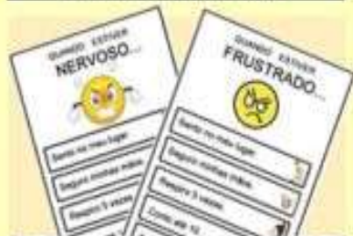
FICHAS DE AUTOCONTROLE