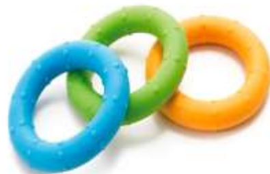
Anéis de resistência