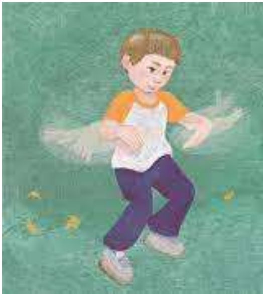
Comportamento de flapping