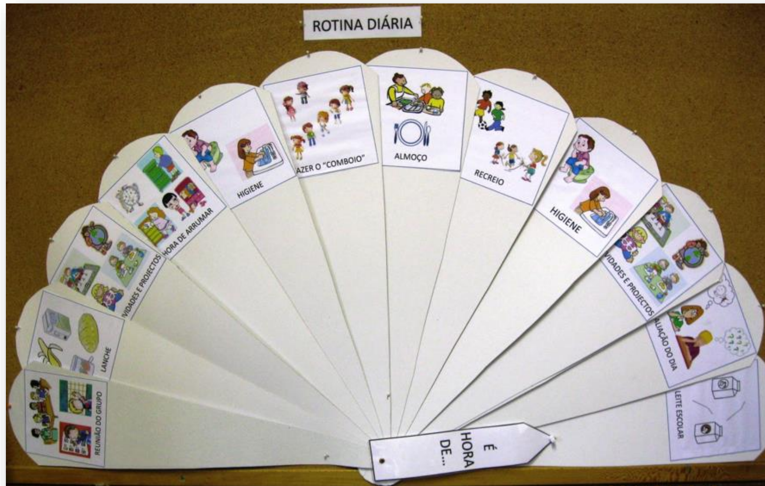
Relógio da rotina