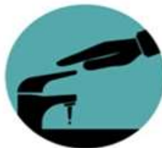
Fechar a torneira