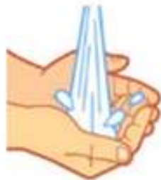
Molhar as mãos