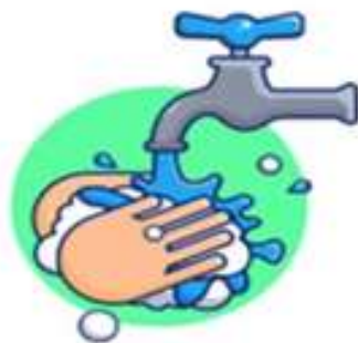
Retirar o sabão