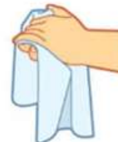
Enxugar as mãos