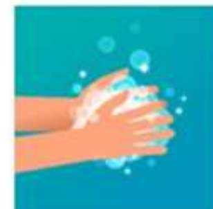
Ensaboar as mãos