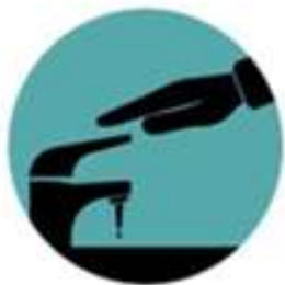
Abrir a torneira